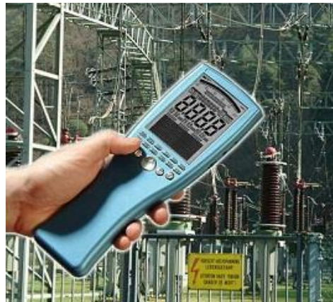
高压电力系统电磁场强度检测