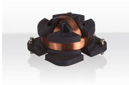
内置三维磁场探头