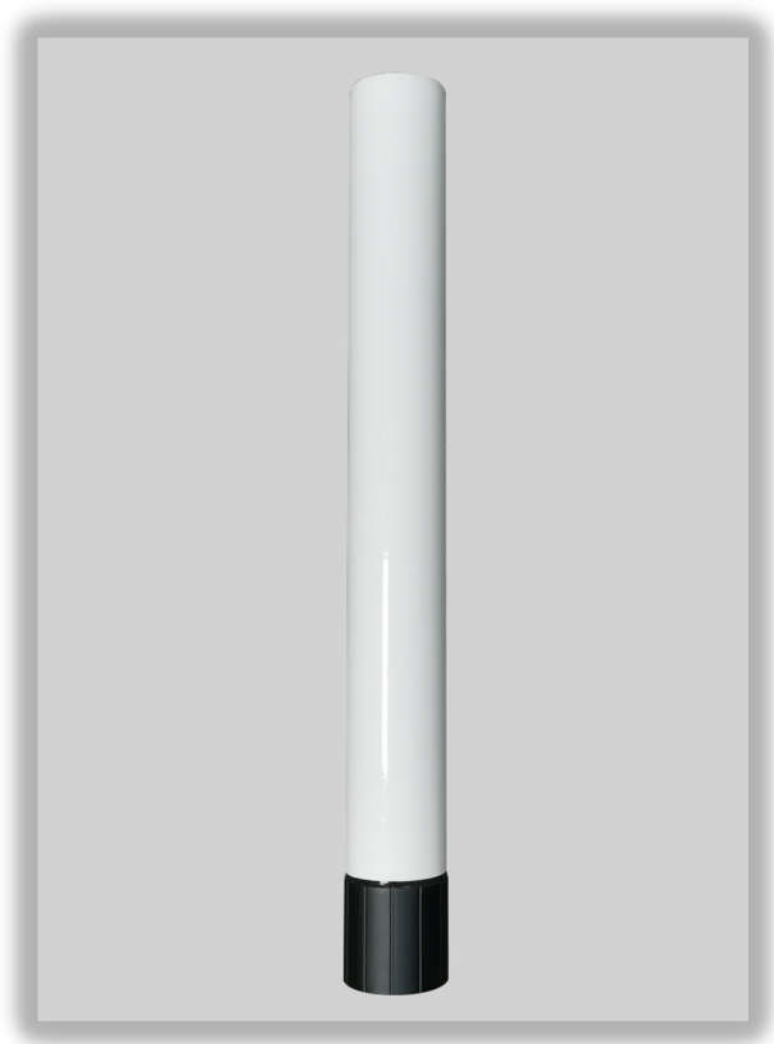
宽频全向监测天线 OTA-20800 ( 20MHz-8GHz )